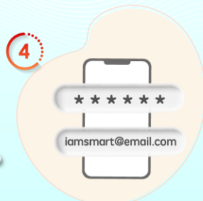
4 設定密碼及電郵地址 (只適用於登記流程)