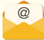
電郵地址 (只適用於登記流程)